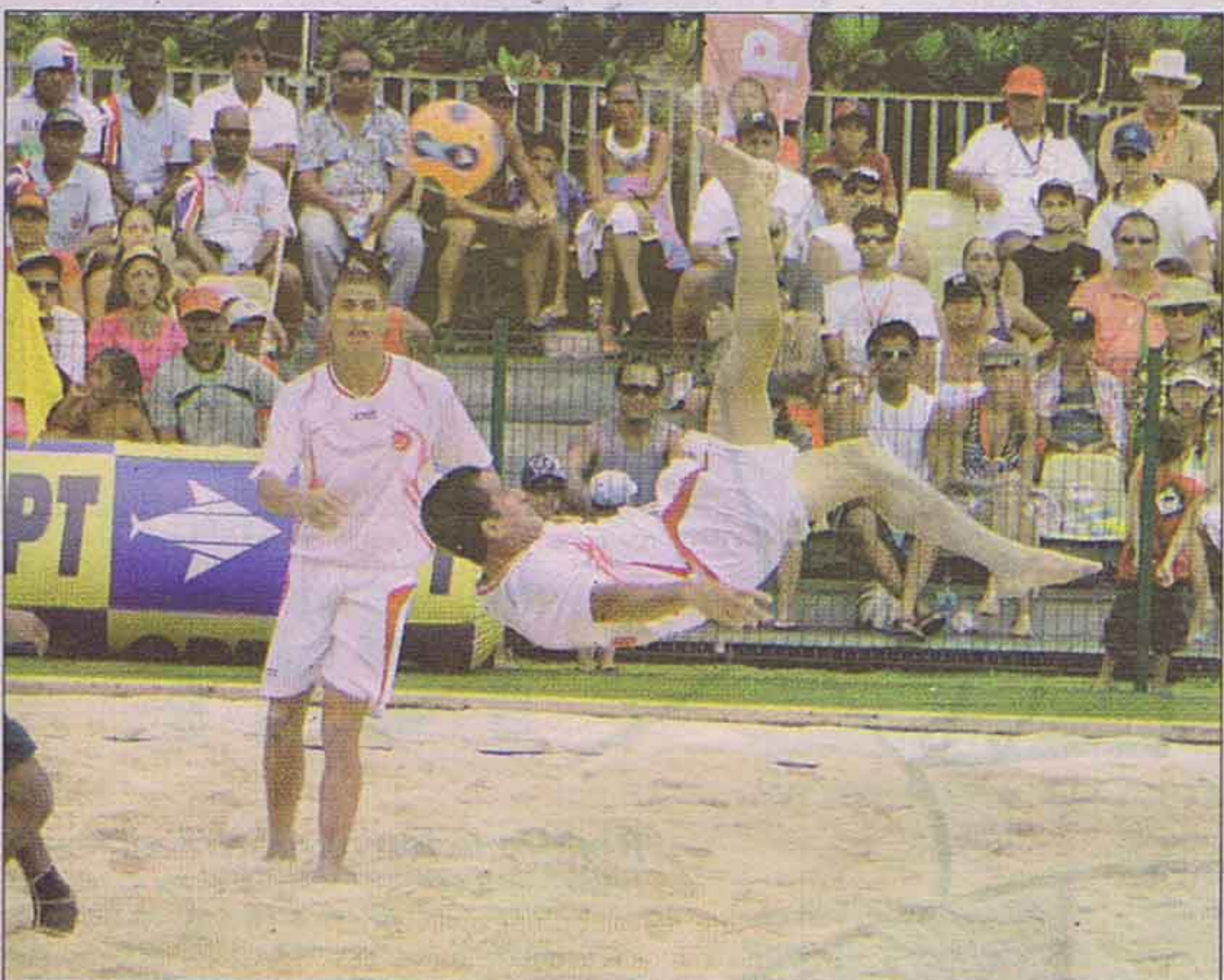
Une qualification pour la phase finale et du spectacle.