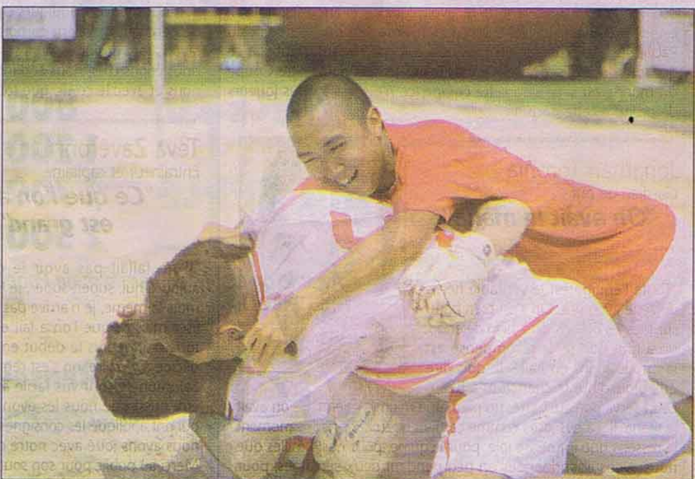
C'est du délire, c'est un véritable exploit qu'on réalisé les Tahitiens.