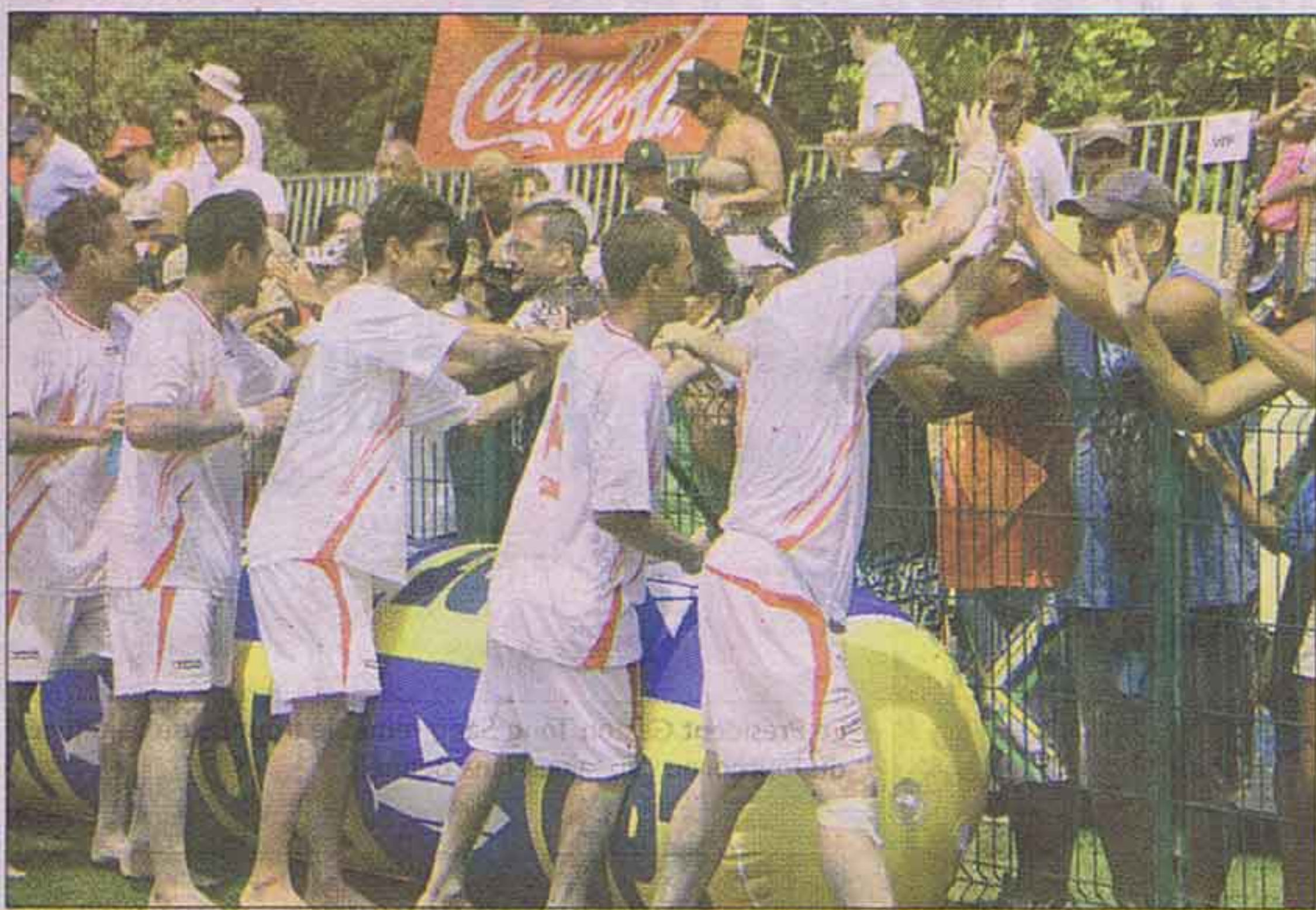
Les joueurs viennent remercier les supporters.