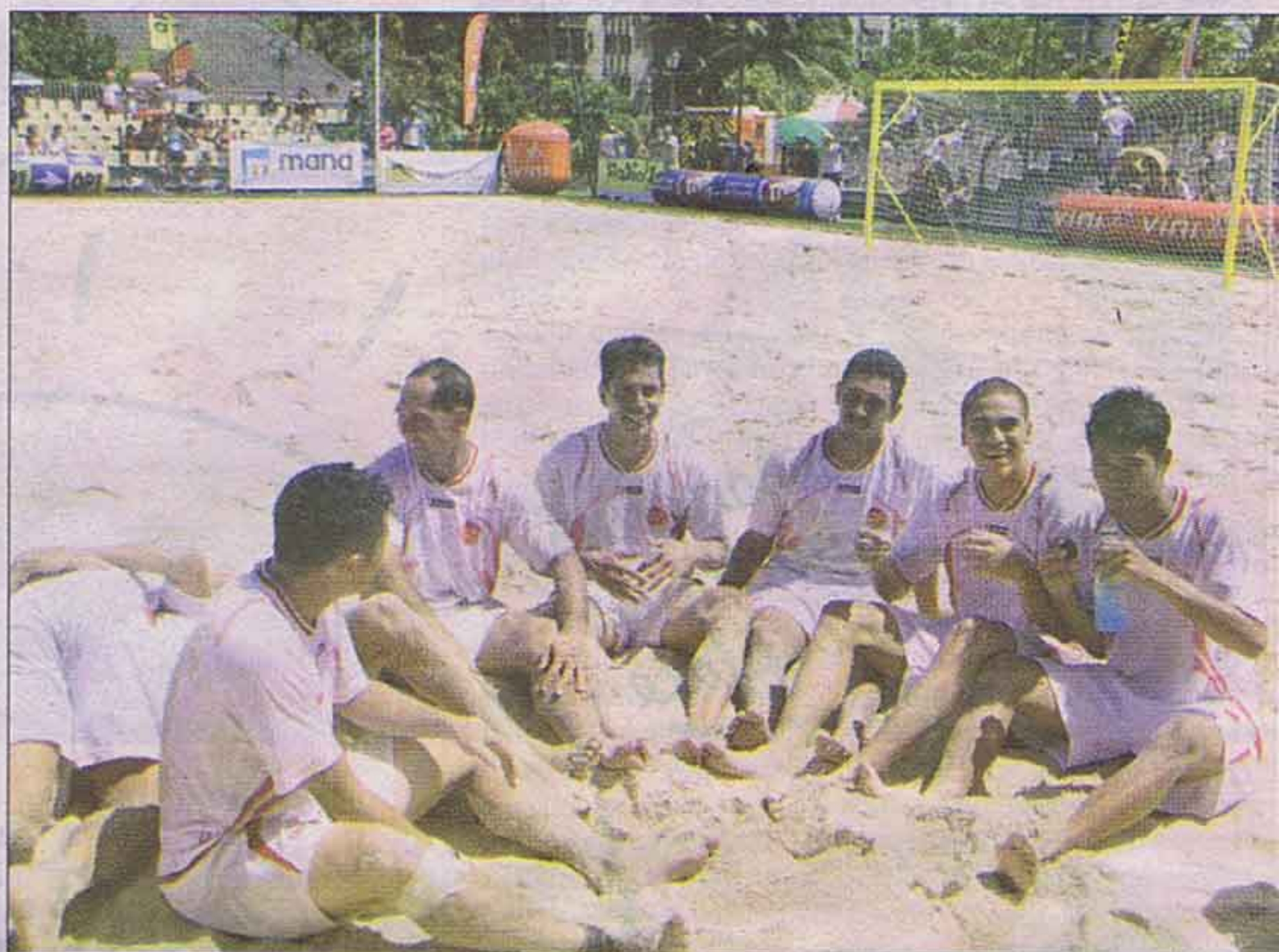
Les joueurs viennent de s'imposer il essaie encore de réaliser l'exploit.

La sélection tahitienne de beach-soccer a réussi un bel exploit en se qualifiant pour la phase finale de la Coupe du monde au terme d'un tournoi qui l'a amené à prendre conscience de ses possibilités.