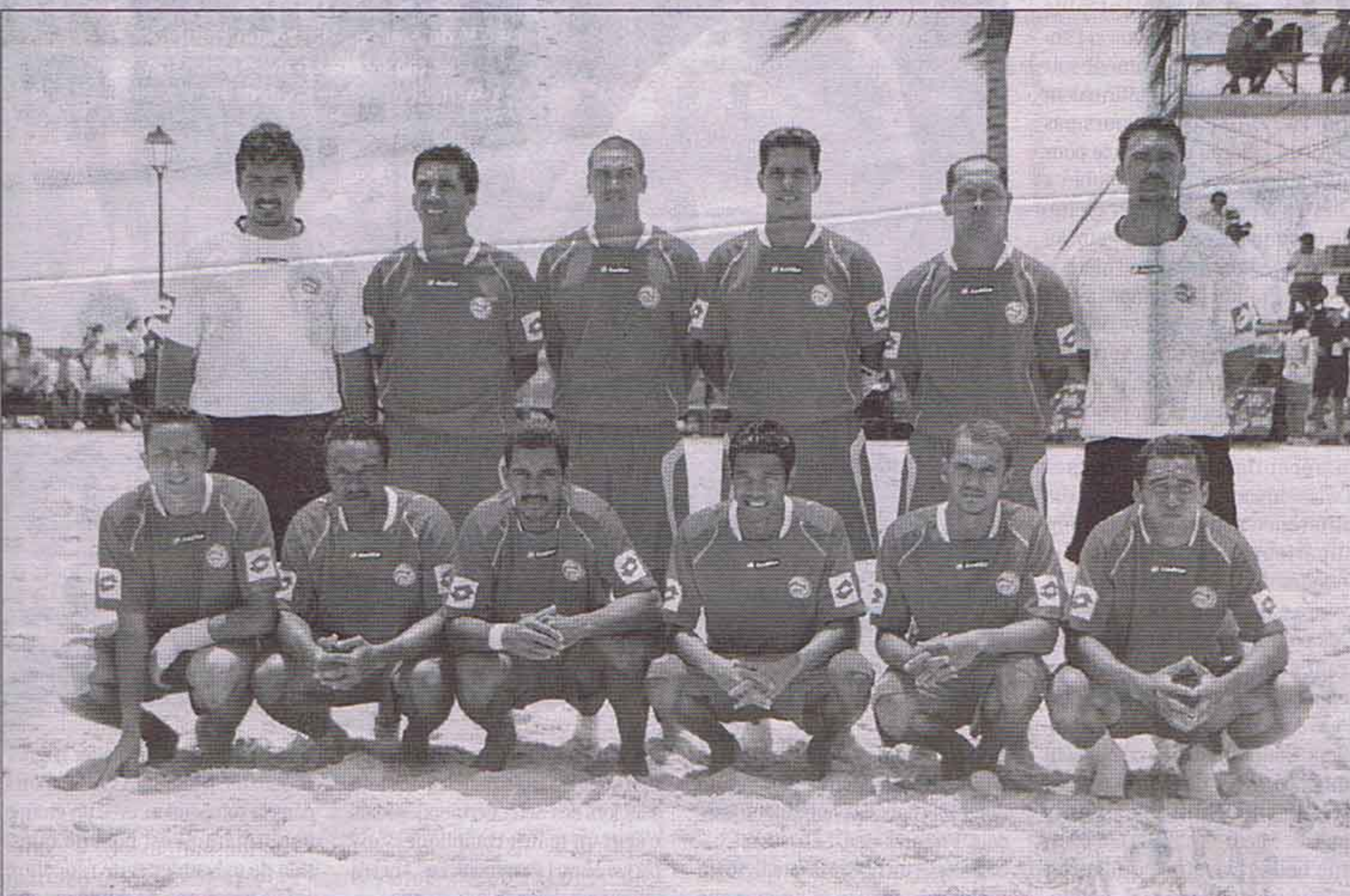
La sélection de Tahiti, douze garçons qui ont conquis le droit de disputer la phase finale de la Coupe du Monde de beach-soccer à Varenne en Italie du 1 er au 11 septembre 2011.